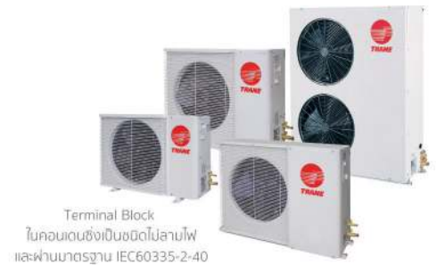
Terminal Block ใบคอนเดนซิ่งเป็นชนิดไม่ลามไฟ และผ่านมาตรฐาน IEC60335-2-40

พร้อมด้วย Condensing Unit ที่มีมาตรฐานการทำงานสูง รับประกันคุณภาพคอมเพรสเซอร์ นานถึง 5 ปี